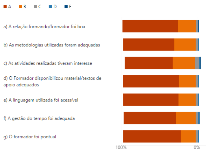
Gráfico 2: Avaliação final dos formadores, por nível de escala utilizada e por item (2020/2021)

Fazendo uma análise global, tendo em conta as respostas obtidas na Ficha de Avaliação do Formador e que se podem observar quer no Quadro 1 quer no Gráfico 2 , denota-se que a resposta mais dada pelos formandos em cada um dos itens avaliados foi Concordo em absoluto seguida de Concordo . Neste sentido, conclui-se que a avaliação final dos formadores , por parte dos formandos, foi bastante positiva .